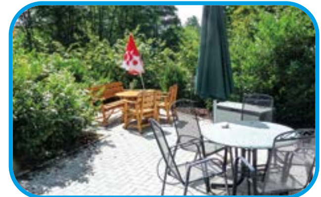
Eine der Terrassen in Steinau