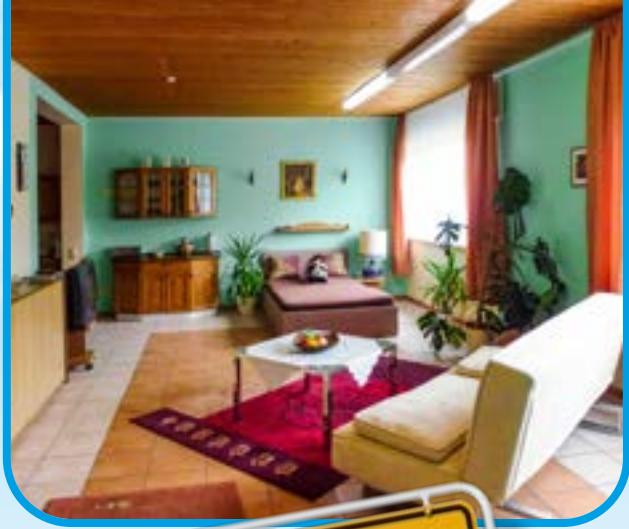
Blick in 's Appartement „Business Suite“