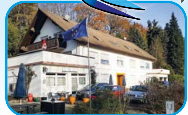
Lage: ruhig und zentral - wenige Geh-Minuten zum Bahnhof, ca. 1,2 km zur A66.