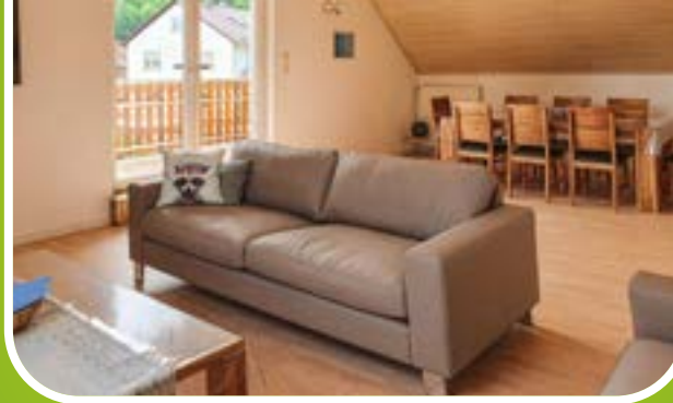
Wohn- und Esszimmer der FeWo „Im Schwalbennest“