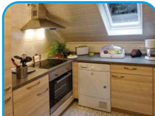
Küche der FeWo „Kinzigblick“

In Steinau ist für jung und alt, alleine und mit vielen etwas dabei. Unsere Wohnungen bieten dafür den optimalen Ausgangspunkt.